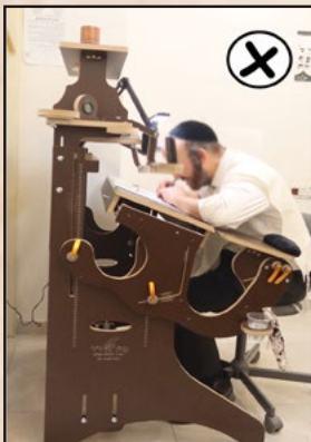
אתה משרת את השולחן: