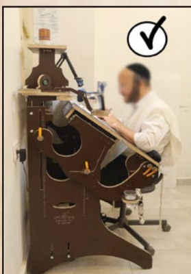
השולחן משרת אותך:

התאמה נכונה של זווית הישיבה מאפשרת לכתוב שנים ארוכות ללא מאמץ וללא כאבי גב