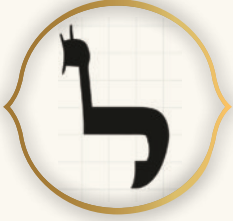
צורות האותיות מותך הספר מקדש מעט מהדורת 'סימא דקדושה'